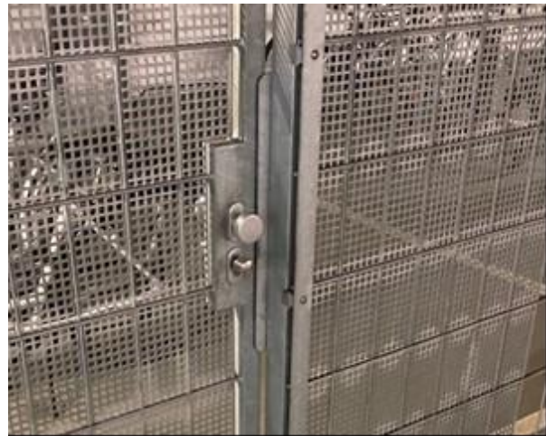
Hinweisschild E-Bike-Ladestation und Schiebtür zum Gitterkäfig