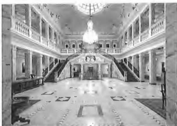
Henkell-Sektkellerei – Marmorsaal

🕒 14:30 📍 Henkell-Sektkellerei, Biebricher Allee 142, 65187 Wiesbaden