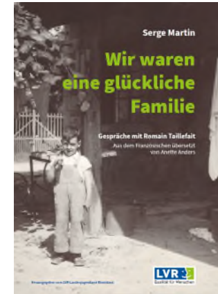
Buch digital hier verfügbar